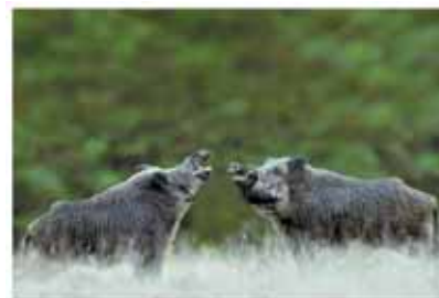
Foto ganadora del Primer Premio Internacional de Fotografía FICAAR 2010.